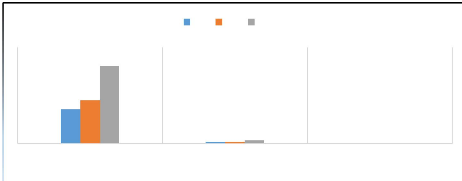
Graphique N°1 . Enlèvements aux Ports ( du 1 er au 15 et 16 au 31 mars 2018)

Ces sorties de flux connaissent une disparité tout à fait normale entre les ports d'une part, et entre les quantités enlevées sur les rubriques statistiques des marchandises d'autre part.