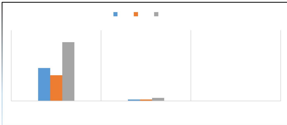
Graphique N°1 : Enlèvements aux Ports (du 1er au 15 Janvier et du 15 au 31 Janvier 2019)

Ces flux de marchandises dans nos différents ports de transit se présentent de manière disproportionnée selon le port et les rubriques statistiques de celles-ci y afférentes.